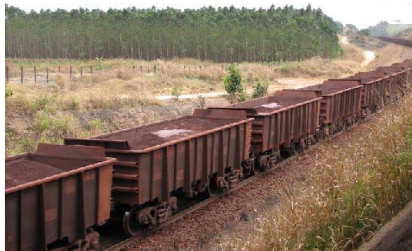
Justicia por la tierra herida por la minera brasileira Vale do Rio Doce.

Por ello, desde fines de 2007, un trabajo en red de los movimientos del norte de Brasil ha lanzado la campaña “Justiça nos Trilhos” ( www.justicanostrilhos.org ), a fin de denunciar los conflictos asociados a la multinacional y clamar una justicia socio ambiental.