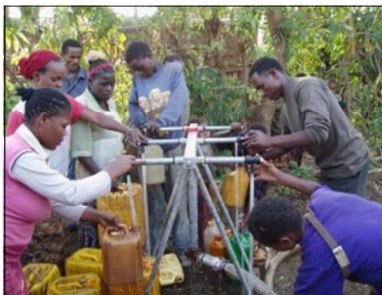
Mujeres y niños que tienen agua de pozo perforado.

Casi todas las comunidades SSpS, ofrecen proyectos a las mujeres para que desarrollen alguna actividad económica, proporcionándoseles un capital inicial. Esto les permite a las mujeres manejar su dinero y contribuir al bienestar de la familia, siendo un poco más independientes. También les brinda una oportunidad para el comercio. Según la experiencia en los diferentes proyectos, las mujeres son más efectivas en la práctica de dichas actividades. Terminan desarrollando habilidades económicas y de relaciones interpersonales y comunitarias.