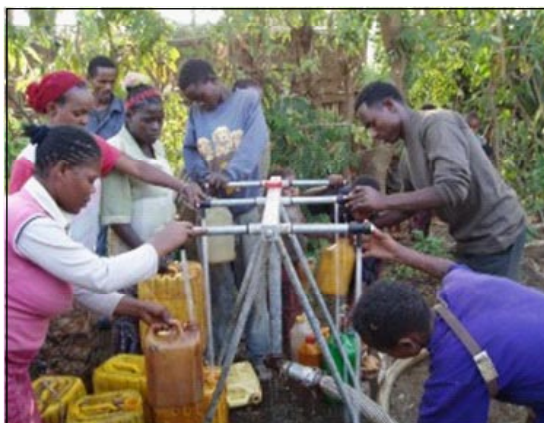
Mujeres y niños que tienen agua de pozo perforado.

Casi todas las comunidades SSpS, ofrecen proyectos a las mujeres para que desarrollen alguna actividad económica, proporcionándoseles un capital inicial. Esto les permite a las mujeres manejar su dinero y contribuir al bienestar de la familia, siendo un poco más independientes. También les brinda una oportunidad para el comercio. Según la experiencia en los diferentes proyectos, las mujeres son más efectivas en la práctica de dichas actividades. Terminan desarrollando habilidades económicas y de relaciones interpersonales y comunitarias.