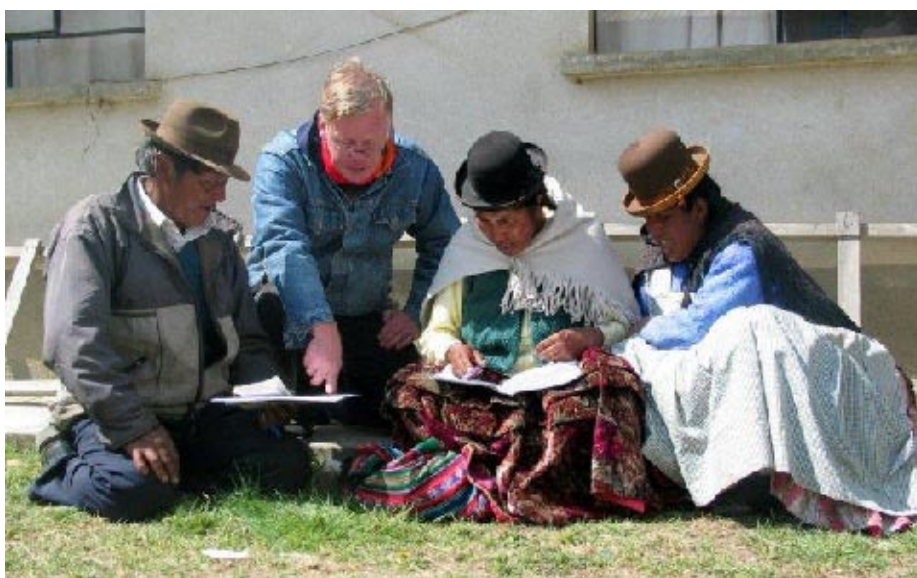
VIVAT members work to promote the value of respect for human life in all peoples and cultures, based on the conviction that an authentic people is one that knows how to respect and care for the most defenseless and fragile life.

informativo. Este año, el Foro de la Sociedad Civil entregó una declaración importante en conmemoración del 15º. Aniversario de la Declaración de Copenhagen. La declaración propugna una “sociedad para todos”, animando a los gobiernos para que adopten políticas y prácticas que promuevan el empoderamiento de las personas para erradi-