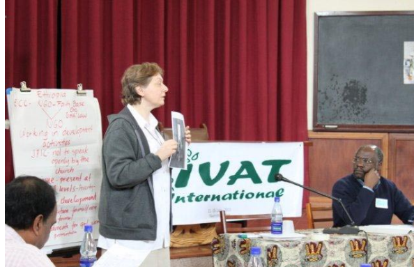
Miembros de VIVAT desde Oriente Medio