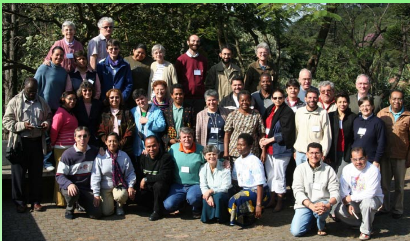
Los participantes del Primer Taller de VIVAT Internacional en San Pablo, Brasil

El taller eligió la “G8” para articular VIVAT Internacional a nivel nacional