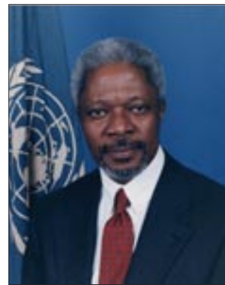
Kofi Annan Secrétaire général des Nations Unies

KOFI ANNAN SECRÉTAIRE GÉNÉRAL DES NATIONS UNIES