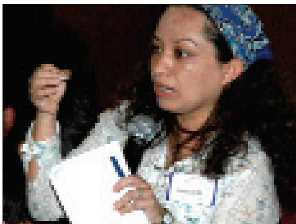
Una joven hace escuchar su voz en una reunión juvenil inter- religiosa.