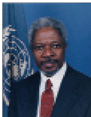
Kofi Annan Secretario General de las Naciones Unidas

KOFI ANNAN SECRETARIO GENERAL DE LAS NACIONES UNIDAS